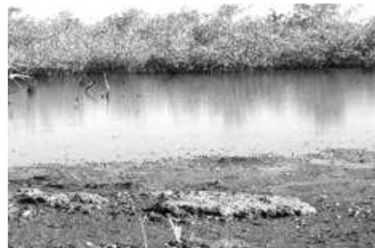
Figura 3. Estructuras trombolíticas que aparecen como elevaciones entre los sedimentos.

Figure 2. Semiconsolidated thrombolitic formation north of El Comitán.