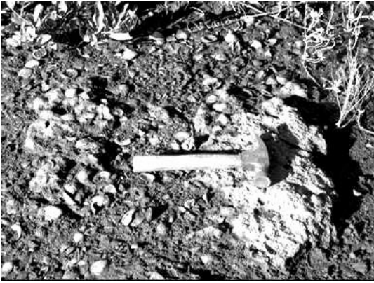
Figura 4. Formaciones trombolíticas expuestas con incrustaciones de conchas.

Figure 4. Exposed thrombolithic formations showing shell incrustations.