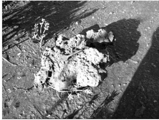
Figura 6. Fragmentos aislados, aparentemente no asociados a estructuras mayores.

Figure 4. Exposed thrombolithic formations showing shell incrustations.