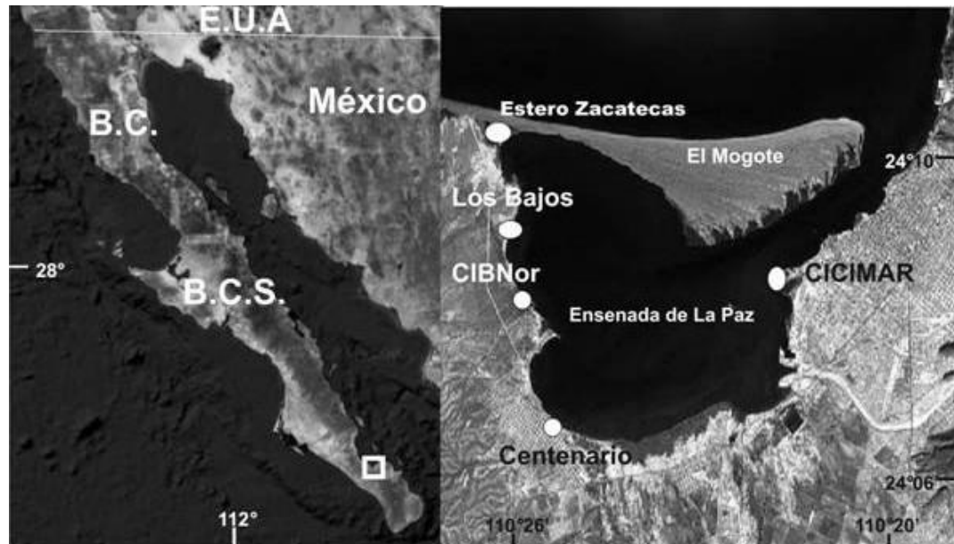
Figura 1. Sitio de muestreo de trombolitos litificados, en el ángulo de El Mogote y la Ensenada de La Paz (E. Zacatecas), y sitios en donde se observaron trombolitos recientes.

Figure 1. Sampling site for lithified thrombolites, where the El Mogote and Ensenada de La Paz (E. Zacatecas) form an angle and sites where recent thrombolites were observed.