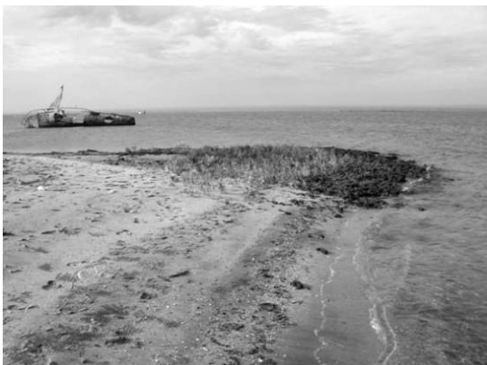
Figura 8. Crecimiento trombolítico que define una punta en el sitio CICIMAR.

Figure 8. Thrombolithic development defining a seaward point at el CICIMAR site.