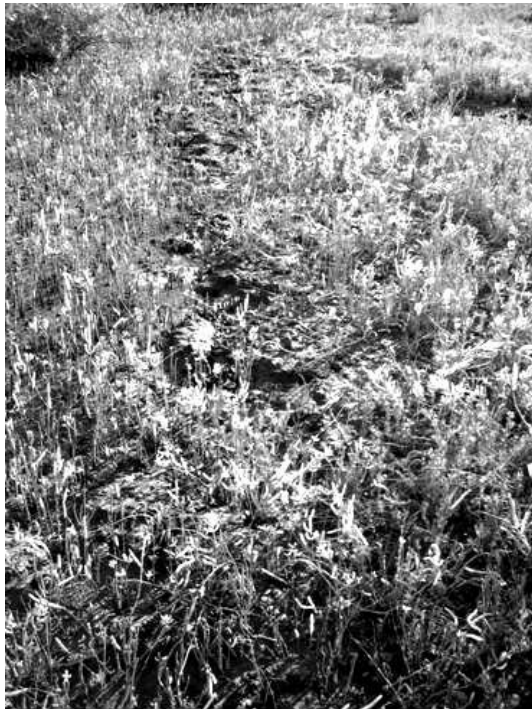
Figura 7. Formaciones trombolíticas extensas con colonización de plantas de marisma.

chas partes de la laguna, habrían generado formaciones trombolíticas, como la “punta hipotética” que finalmente originó la barra arenosa El Mogote, que separó la ensenada primitiva y dando lugar a la laguna de La Paz. Otras puntas en la laguna coinciden con la presencia de trombolitos activos o formaciones trombolíticas, e.g. , El Centenario y El Co-