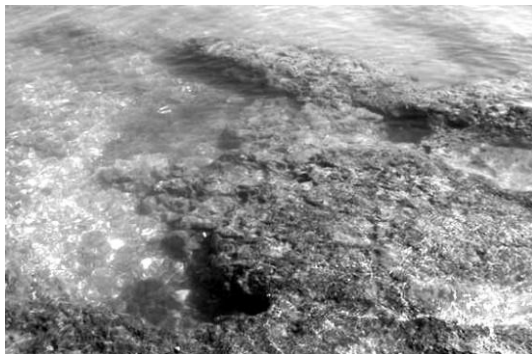
Figura 2. Formación trombolítica semiconsolidada, al N de El Comitán.

Figure 1. Sampling site for lithified thrombolites, where the El Mogote and Ensenada de La Paz (E. Zacatecas) form an angle and sites where recent thrombolites were observed.